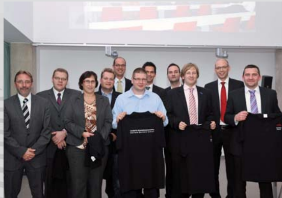
Der erste Studienjahrgang beim Start im Oktober 2010